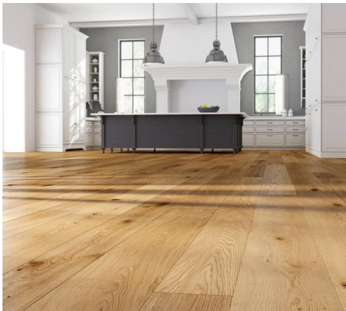
ÜHELIPILINE TAMMEPUIDUST SPOONPARKETT