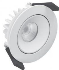
LED PIRNIGA OSRAM LEDVANCE SPOT SÜVISVALGUSTI ESIK, KORIDOR, KÖÖK