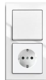
PISTIKUPESAD, LÜLITID ABB BUSCH-JAEGER AXCENT SARJAST