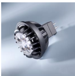
LED PIRN PHILIPS MASTER LED SPOT NING SÜVISVALGUSTI BIOLEDEX INO WC, VANNITUBA, SAUNA EESRUUM